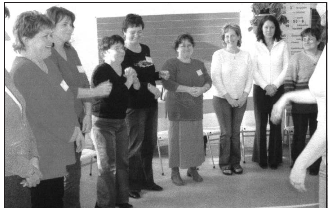
Így játszunk mi!