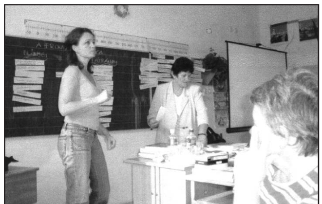
Így kell ezt csinálni???