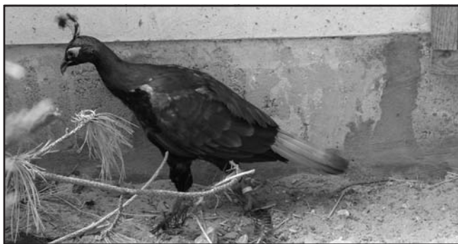
A Himalájai Fényfácán

A pazarul kialakított volierson-ahogy ők hívják-a röpdék, a nyitott,