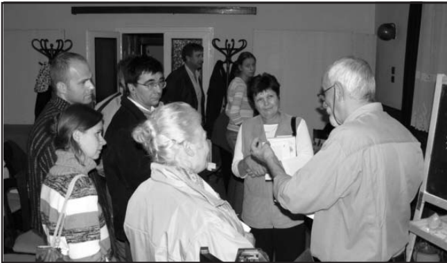
Repeta - kiselőadás az előadás után