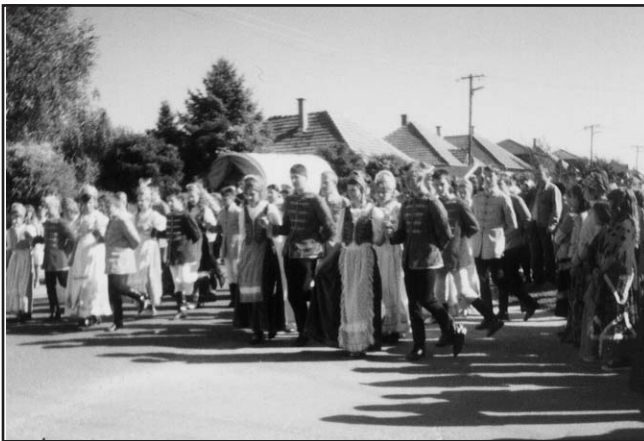
A hagyományos díszpalotás Újlengyelben