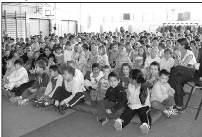
A lelkes publikum