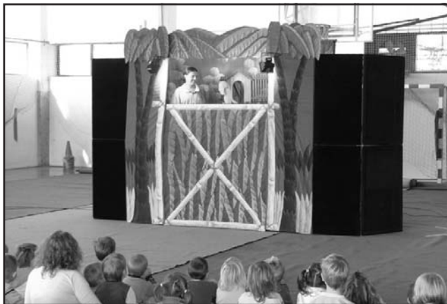
A kiskutya és „mozgatója”

Egy éves képzés a 16. életévet betöltött és 8. osztályt nem végzett fiatalok részére. Az előkészítő évfolyam sikeres elvégzését követően a tanulók tanulmányaikat folytathatják a kőműves, kereskedő vagy női ruha-készítő szakképzés 11. évfolyamán.