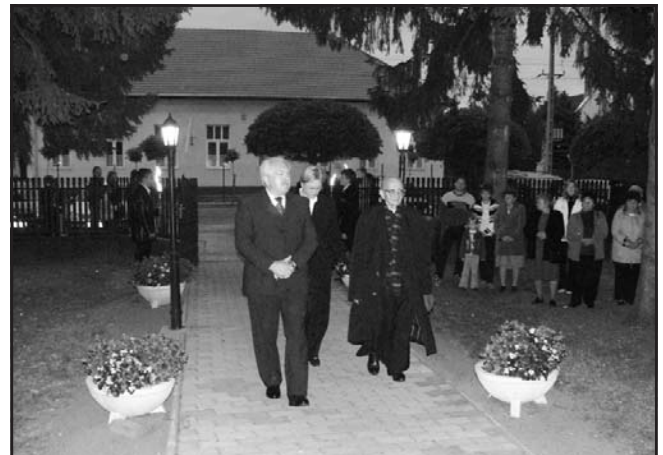
Érkeznek a vezetők Újlengyelben