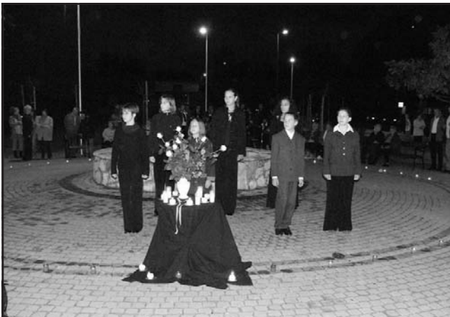
Az irodalmi műsor előadói