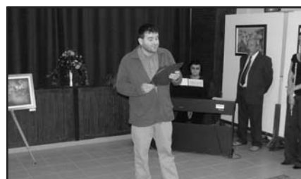
Nagy Viktor színművész