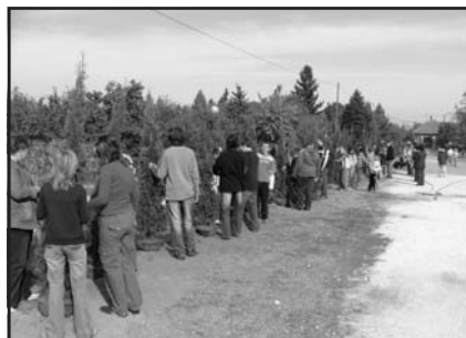
Faültetés a hernádi iskola udvarán