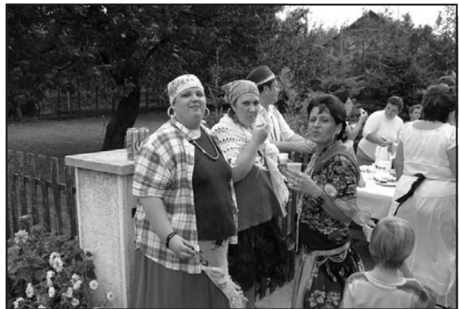
Megéheztek a „cigányasszonyok”