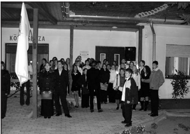
Az újlengyeli előadás szereplői