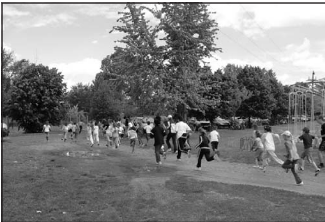
Indul a futás