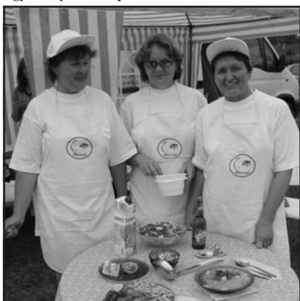
Egy tavalyi főzőcsapat

A gyerekeket gyermekprogramokkal várjuk. Lesz arcfestés, kézműves sátor, aszfaltrajz verseny, Dezső bácsi kisállat simogatója, lovaglási lehetőség, qvad motorok kicsiknek és nagyoknak. Egész nap körhinta, céllövölde, ugrálóvár.