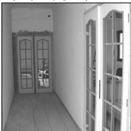
Az új szárny két helyiségének bejárata

A bővítés mellett a felújítás is nagyon fontos volt, mert bár munkatársaink igyekeztek mindig a legnagyobb rendben tartani az épületet, mégis látszott, hogy az előtér a tető elhasználódása miatt beázik, a nagyterem műanyag álmennyezete felett eljárt az idő, a konvektorok pedig 23 év becsületes szolgálat után megérdemlik a nyugdíjat.