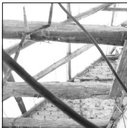
Kicsérélték a rossz födémét is