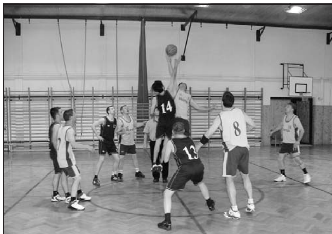
Kezds a PITYUK csapata ellen