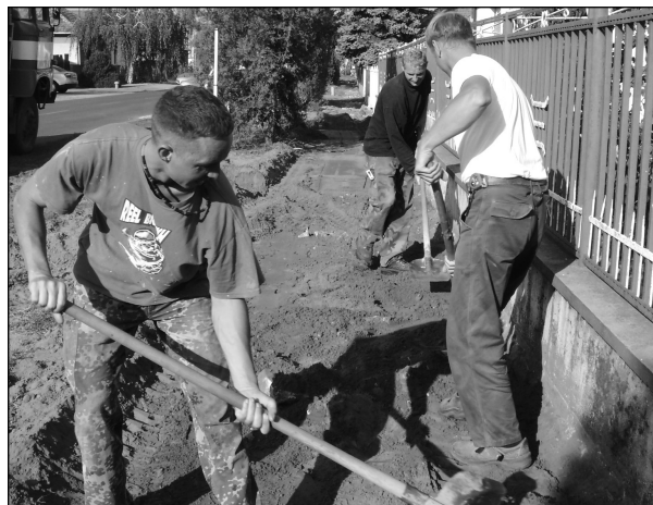
Épül a járda a Köztársaság úton

Az épület a Magyar Posta Zrt. tulajdona, így annak bővítése, felújítása csakis az ő döntésének függvénye. A számtalan panasz hatására az önkormányzat levéllel fordult a vezérigazgatóhoz, amelyben javasolja a bővítést.