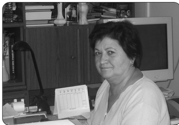
Szinte mindenkit ismer a faluban

Noha megkerestek jó lehetőségekkel, nem volt bennem soha késztetés arra, hogy mást csináljak. Nagyon szerettem például a kirendeltségvezetést. Mindig volt időm az ügyfelekre, akik ügyeit a lehető legpontosabban, naprakészen, gyorsan kellett elvégezniem. Igyekeztem velük nagyon jó viszonyt kiépíteni. Aztán 1984. január 1-jétől, amikor Hernád község önállóvá vált, kezdtem foglalkozni a szociális, hagyatéki, anyakönyvi és gyámügyekkel. Az elmúlt évtizedekben jelen voltam valamennyi népszámlálásnál és valamennyi választásnál, amely mindig hatalmas munka volt. 1970-ben 2086 lakosa volt