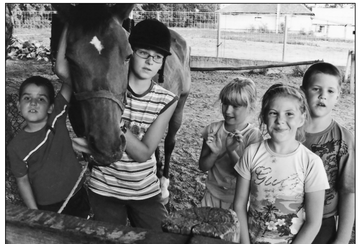
Egy tapasztalt és négy tanuló lovas (meg a ló)