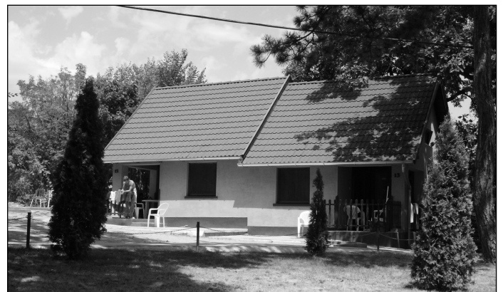
Egy a sok szép kőház közül

Mint minden jó, a tábor is véget ért egyszer. A táborútnál