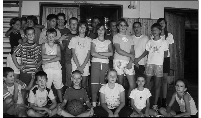
A jó hangulatú tábor résztvevői

Péntekre izomlázunk lett, nagyon elfáradtunk, de szomorúak is voltunk, hogy vége a tábornak, vége a nyárnak!