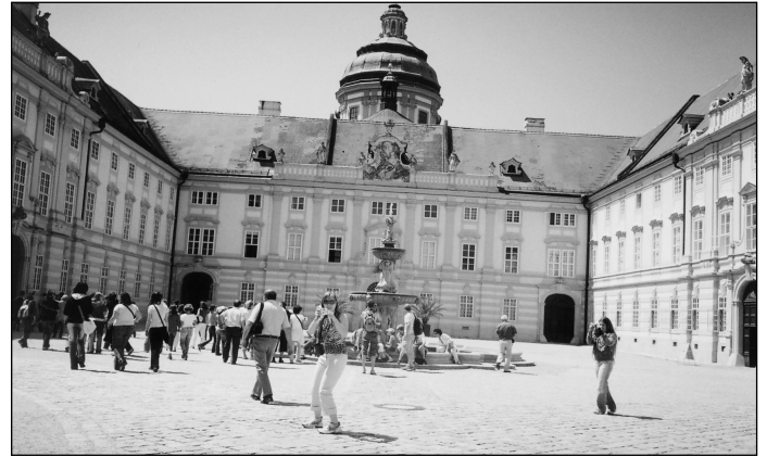
A melki apátságban is jártak

mesterei lettünk e hét alatt. Sokat tanultunk, de nem csak a német nyelvről, hanem megtanultunk vigyázni az értékeinkre és magunkra is, valamint azt, hogyan értsük meg magunkat másokkal. A hazaindulás napját senki sem várta igazán. „Majd jövőre!” – ez a két szó szinte minden diák szájából elhangzott. Búcsúzkodtunk az isaszegi diákoktól, valamint a kedvenc isaszegi tanár néinktől, és indultunk tovább a hazavezető úton. Itthon szüleink már nagyon vártak. Remélem, e cikk olvasása közben Önök is kedvet kapnak egy ilyen felejthetetlen kiránduláshoz!