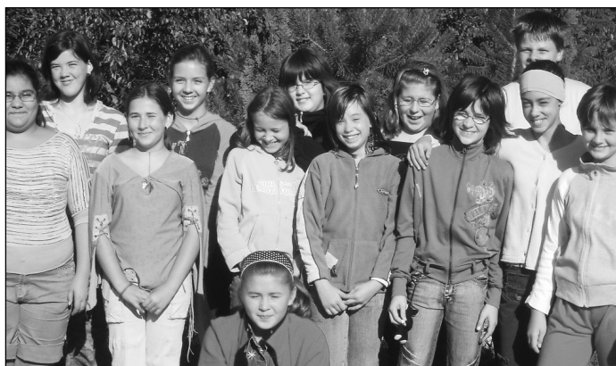
Sok diák nagyon várta már a tanévkezdést

A vidám vakáció, önfeledt szórakozás, táborozás után négyszáz hernádi nebuló ült az iskolapadba, közülük ötvenketten kezdi az első osztályt, és negyvenhét végzős gondolkodhat a továbbtanuláson: nekik már decemberre el kell dönteniük, hová küldjék jelentkezési lapjukat.