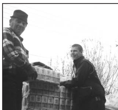
Az adomány-liszt lepakolása