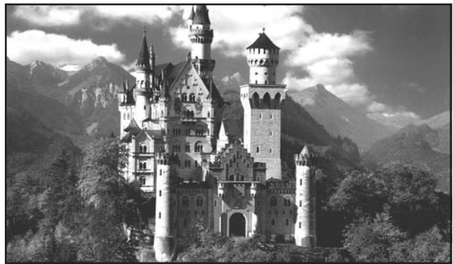
A Neuschwanstein-i kastély

Újhartán Német Nemzetiségi Általános Iskola