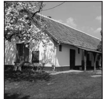
A hernádi vadászház

ben feltett kérdést nem tudjuk megválaszolni, de képet kaptunk a törekvés irányáról. Vadászoknak nem illik szerencsét kívánni. Azt azonban lehet, hogy e törekvésnek sikeres megvalósulását kívánjuk.