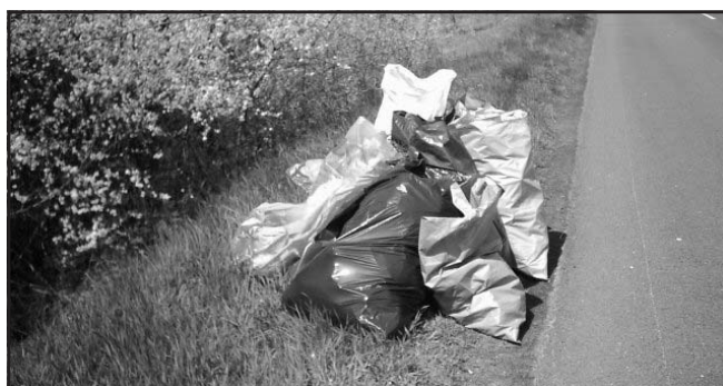
Ennyi szemetet találtunk egy helyen

Nagyon lelkes, ügyes társaság gyűlt össze, hogy az eldobott szemetet összegyűjtse.