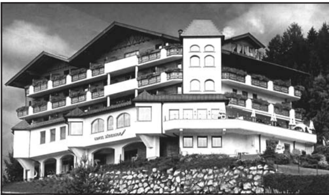
A hotel amelyben laktunk

Meglátogattuk a világhírű Swarovski kristálmúzeumot, ahol megcsodálhattuk a szebbnél-szebb kristályokat és játszótérrel, művészeti alkotásokkal, labirintussal kialakított alpesi kert.