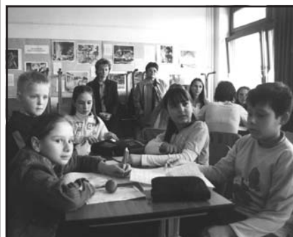
A gyerekek munka közben