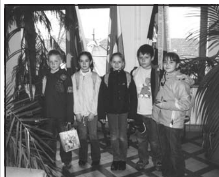
A versenyző csapat