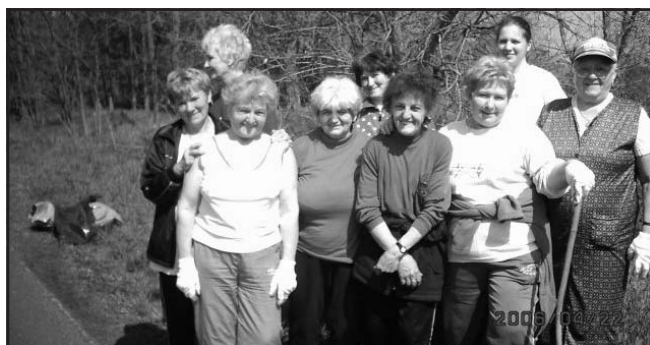
Nagyon lelkes társaság