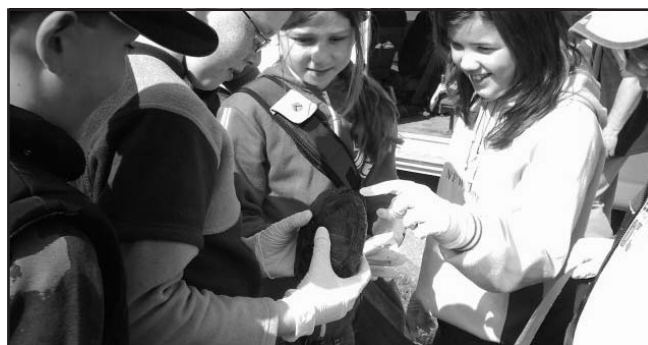
Természetismeret óra (teknőst találtunk)