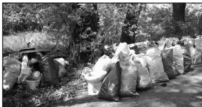
A végeredmény egy része