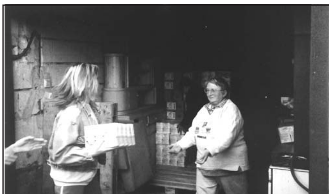
De jó, hogy a tésztát már leraktuk!