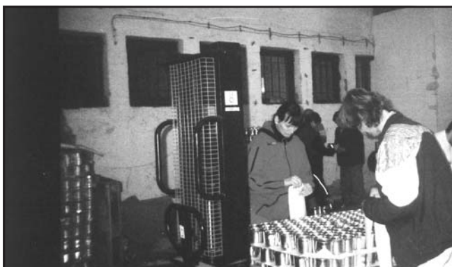
Csak ragasztunk és ragasztunk...