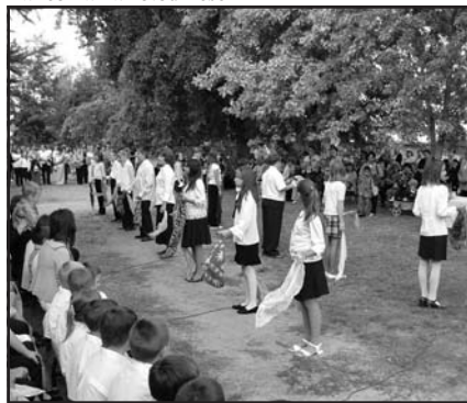
Táncolnak az ötödikesek